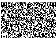
vcard_erick.png 9 KB

Dra. Jéssica Elaine Innovate Brazil painel de Led OAB/GO 59.303 (62)99973-0483 ou (62) 98623-4313